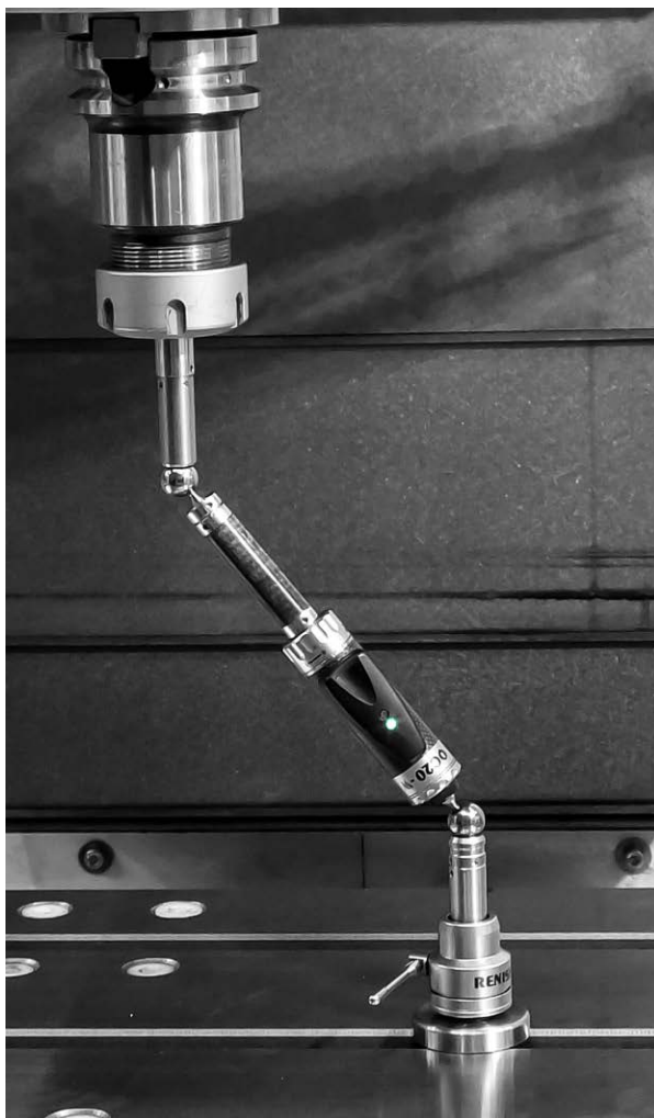
StankoMachComplex wykorzystuje kinematyczny pręt kulowy QC20-W do monitorowania stanu technicznego obrabiarki