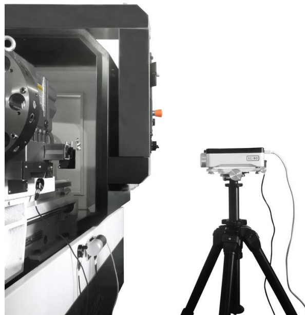
Sprawdzanie dokładności przemieszczeń osi obrabiarek przy użyciu laserowego systemu XL-80

Każda obrabiarka opuszczająca fabrykę w Twerze została poddana intensywnemu procesowi weryfikacji, na który składają się: testy bez obciążenia, testy z obciążeniem i testy dokładności geometrycznej. Najważniejsze są precyzja i powtarzalność produktu.