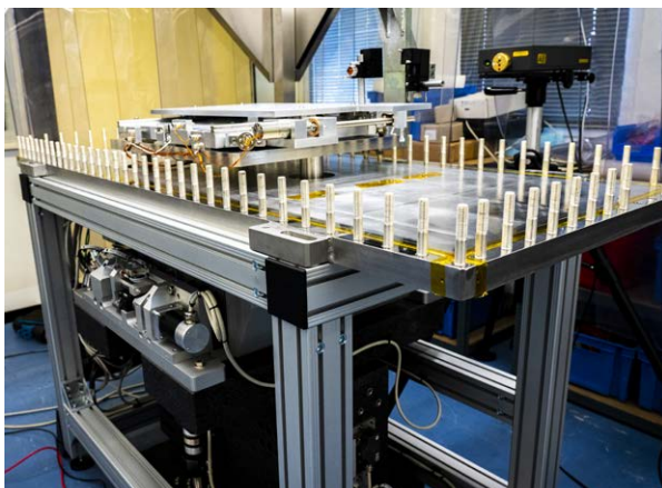
인에어 및 진공 상태 모션 스테이지가 있는 미러 플랫폼

각 IRELEC 미러 시스템을 고객에게 전달하기 전에 Renishaw의 XL-80 레이저 간섭계를 사용해 캘리브레이션 및 검증을 수행합니다. XL-80은 빠르고 정확하며 휴대가 간편한 간섭 측정 시스템으로 리니어 정확도가 \pm 0.5 ppm입니다.